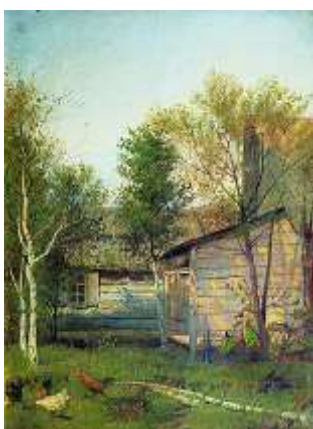
Солнечный день. Весна.

«Левитан был поэтом русской природы, он был проникнут любовью к ней, она поглощала всю его чуткую душу», - писал о художнике его близкий друг К. Коровин. Печальные равнины с рощами белоствольных берез и трепетных осинок, окольные дороги, деревенские сизые избы и сараи, разбросанные по пригоркам, золотой наряд осенних грустных дней нашли своего выразителя в лице Левитана.