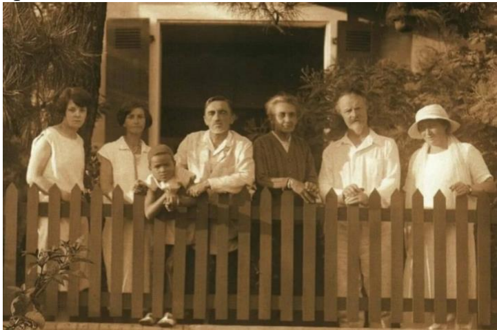
Семьи Бальмонтов и Шмелевых

После Февральской революции Шмелев с женой решили уехать жить в Крым. В 1920 году Красная Армия заняла Крым. Сына литератора – Сергея Шмелёва, который воевал на стороне «белого» генерала Деникина, расстреляли вместе с другими военнослужащими. Родители ничего не знали о его судьбе: до 1922 года Шмелёвы оставались в Алуште и надеялись найти его среди живых. Работы не было, и писателю часто приходилось голодать.