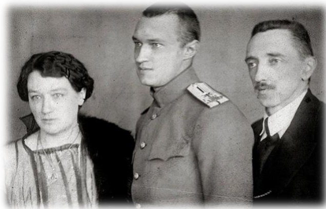
Иван Шмелев со своей семьей

Впервые «Солнце мертвых» было опубликовано в 1923 году, в эмигрантском сборнике «Окно», а в 1924 году вышло отдельной книгой. Сразу же последовали переводы на французский, немецкий, английский, и ряд других языков, что для русского писателя-эмигранта, да еще неизвестного в Европе, было большой редкостью.