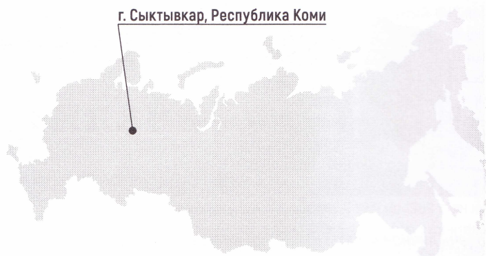
г. Сыктывкар, Республика Коми