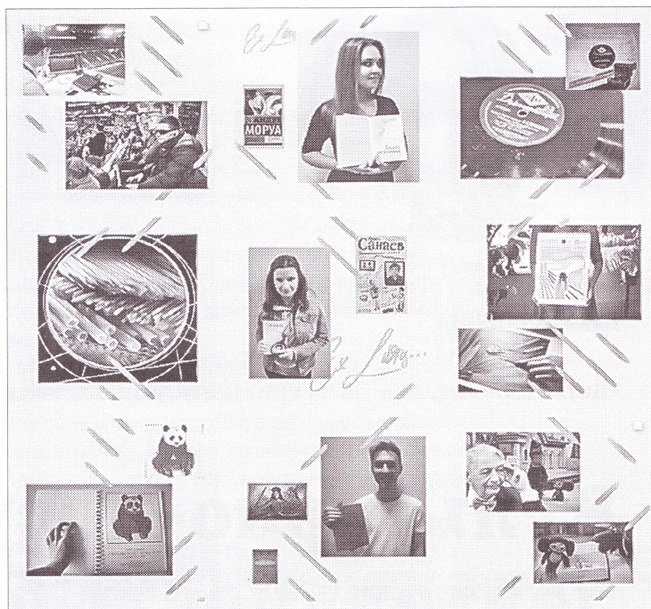
▲ Иногда полезно выходить за границы привычного. Это касается и фотографий в «Инстаграме». Так ведёт свой аккаунт Санкт-Петербургская государственная специальная центральная библиотека для слепых и слабовидящих (@libraryforblind)

Следите за тем, чтобы на разных снимках присутствовали элементы одного тона, либо прида-