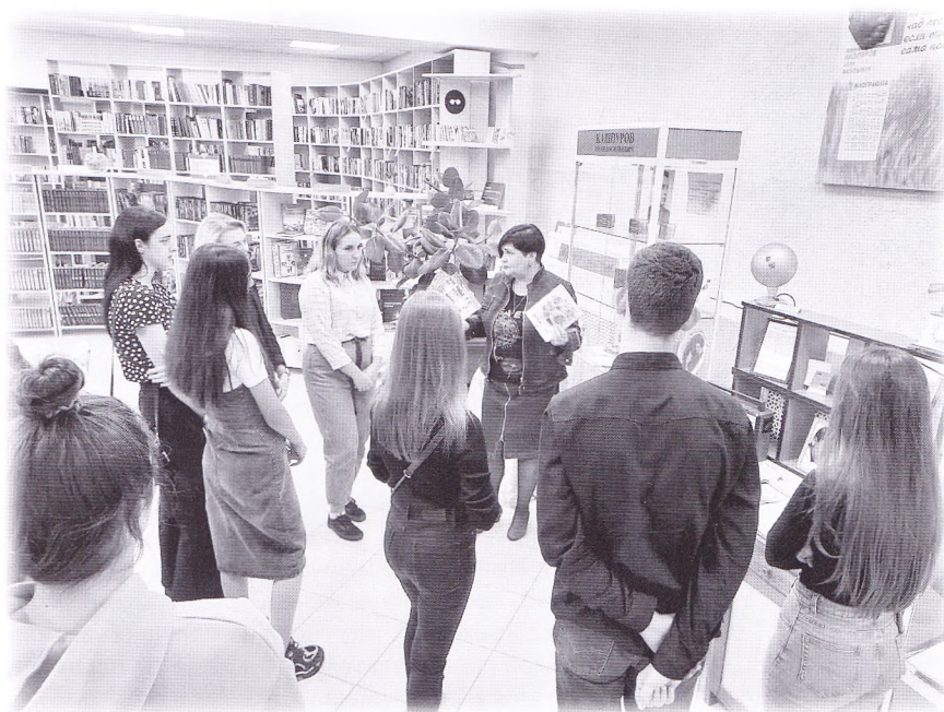
Экскурсия в библиотеке

Под впечатлением от прочитанных стихотворений студенты и школьники пишут свои поэтические произведения, читают их перед аудиторией в библиотеке.