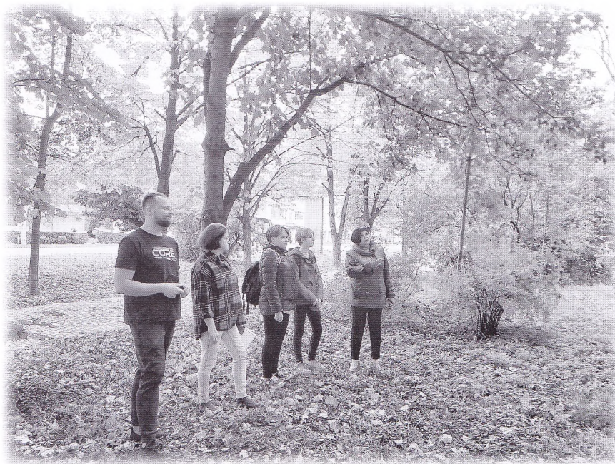
Возле дома поэта

форм, способствующих созданию положительного имиджа, формируют востребованность краеведческой информации, а также ищут социальных партнёров, в том числе связанных с туристической деятельностью. Сотрудничество с краеведческими музеями, архивами, местными краеведами, общественными объединениями и школами повышает качество и статус проводимых мероприятий. Модельная библиотека нового поколения им. И.В. Кашпунова – единственная в Ставропольском крае, которая работает в этом направлении и занимает свою, особую нишу в системе сохранения, изучения и возрождения интереса к туристическому и историко-культурному наследию региона.