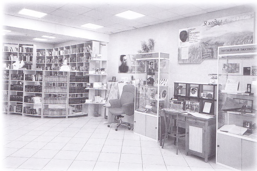
Общий вид экспозиции

Краеведческий туризм – мощный импульс развития библиотек. Задачи туристического обслуживания в библиотеке выполняют краеведческие уголки и музейные экспозиции, что подчёркивает индивидуальность библиотеки.