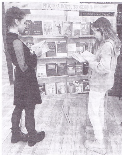
Лекция «Наука убеждать. Ораторское искусство 21 века». Книжная выставка из фондов библиотеки

Следующим шагом стало подключение к билетной системе. После изучения