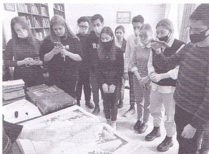
Научный лекторий. Лекция «История — в твоих руках! Редкие книги и их истории»

✓«Научный лекторий» начал работу в конце октября. Его преимущество перед отдельными лекциями-беседами состояло в возможности для старшеклассников всестороннего и углублённого изучения темы. Лекторами стали интересные люди, профессионалы своего дела, готовые поделиться знаниями с думающей аудиторией — преподаватели