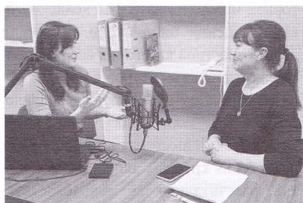
Запись подкаста для краеведческого проекта. Диалог с музейным работником

Однако недостаточно перестроить кадровый состав; необходимо изменить всю внутреннюю работу, модернизировать внешний вид помещений и материально-техническую базу. Большинство библиотек района не соответствуют современному представлению молодёжи об «умном и комфортном» пространстве, в котором приятно и удобно проводить своё время. Несмотря на то, что наши библиотеки не могут стать участниками федерального проекта по созданию модельных муниципальных библиотек в силу ряда причин, мы ищем другие пути для развития и создания такого физического и виртуального пространства, которое будет соответствовать требованиям пользователей, будет комфортным для всех групп. По мере материальных возможностей в библио-