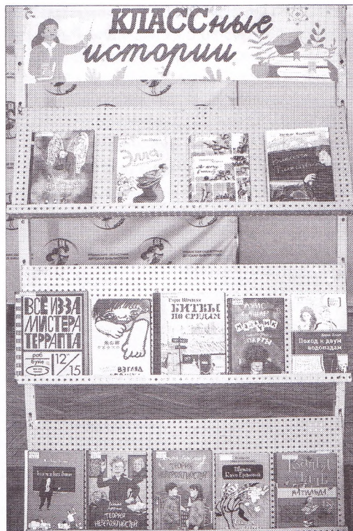
◀ Эта выставка предлагала всем желающим познакомиться с обзором подростковой литературы о школе, педагогах

► III этап – областной профессиональный конкурс «Учитель с большой буквы», который проходил с апреля по октябрь. В течение этого